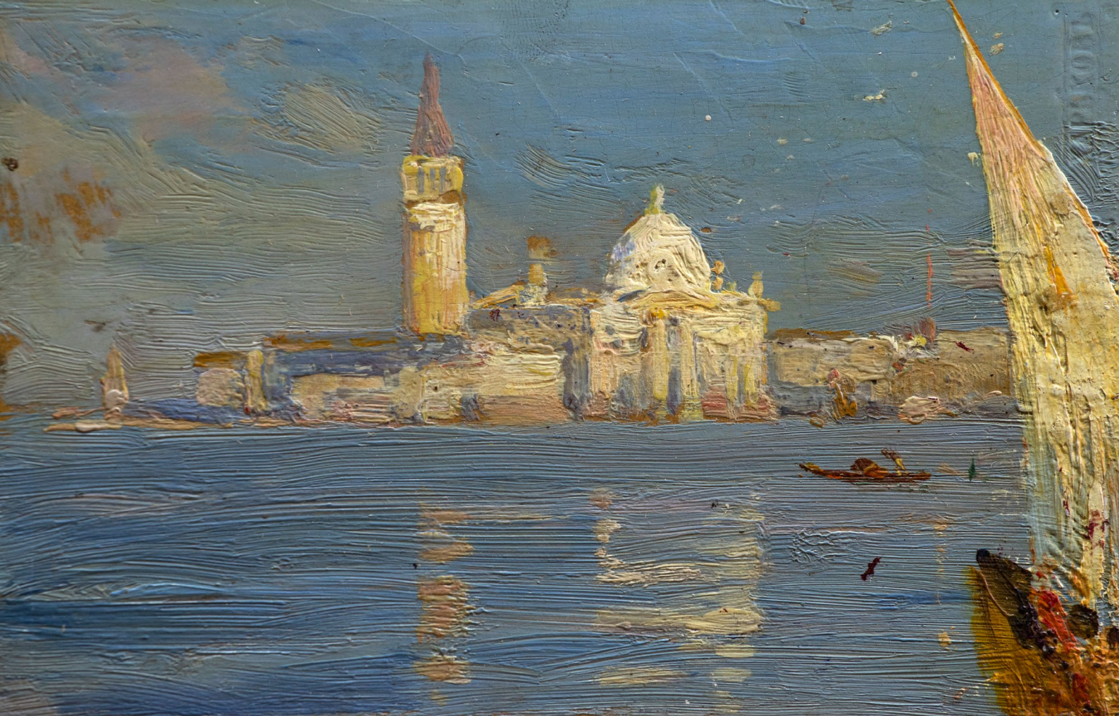
Етюд, Венеція, 1887