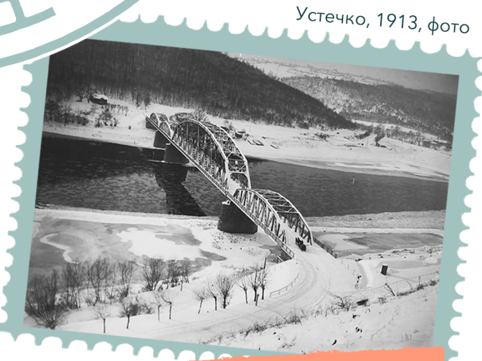
Устечко, 1913, фото

Це – Ед Коч, один із найвідоміших мерів Нью-Йорка, виступає на з'їзді українців Америки.